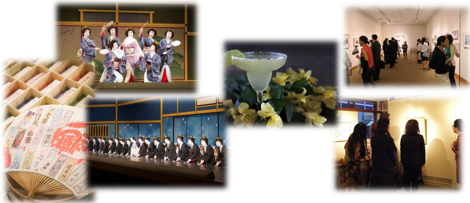
東をどり